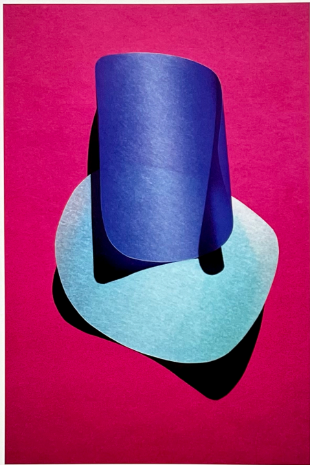
Das Zusammenwirken von Licht, Schatten und starken Farben in „Sekunden-Skulpturen“ zeichnet die neue „Cut Out“-Reihe der deutschen Fotokünstlerin aus.