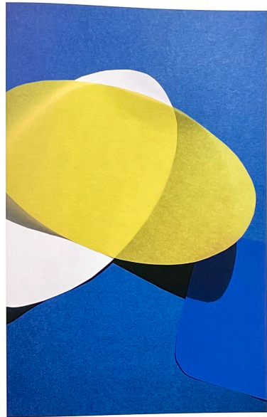
Motive aus Jessica Backhaus neuem Projekt „Cut Out“