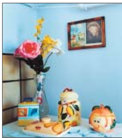
Jessica Backhaus fand ihre Motive im Dorf Neto und Umgebung.

man. – Die polnische Provinz ist bunt. Zuweilen grellbunt. Mal bilden eine rosa Plastikschüssel und ein paar Karotten einen heftigen Farbkontrast. Dann sind es weiße Häkeldeckchen auf einem roten Sofa unter einem pastellfarbenen Heiligenbild. Eine weitere Aufnahme lässt Rote-Beete-Saft von einem leeren Teller aufstrahlen.